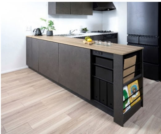
「ファミリーキッチン」写真

長谷工グループは今後もお客様一人ひとりの声を真摯に受け止め、住まいの課題の本質を見極めながら、困りごとの解決につながる商品開発を目指してまいります。