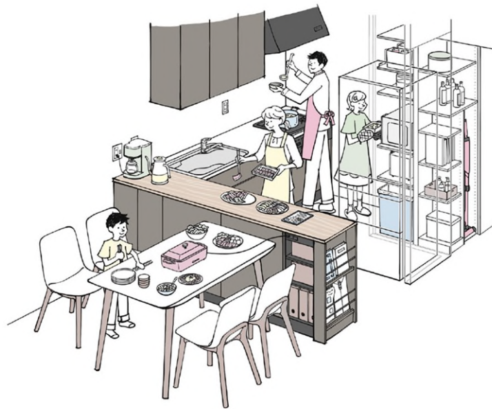
「ファミリーキッチン」利用イメージ