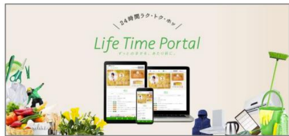
「Life Time Portal」