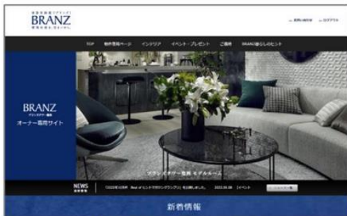
「BRANZ WEB (オーナーサイト)」

不要になった木製家具などを居住者さまが手放したい場合に、BRANZ オーナーサイトにて買取プラットフォーム「ウリドキ」によるリユースサービスのご利用支援を行っています。ご入居後のアフターサポートとしてご利用可能なオーナーサイト「BRANZ WEB」とマンションの便利メニューをご紹介する「Life Time Portal」のそれぞれから入れる専用ページにて、売りたい商品をご登録いただけます。ご登録いただいた商品は、ウリドキが提携するリユース会社が査定を実施します。条件の合意後、リユース会社買取を行い、居住者さまは買取金額を受け取ることができます。