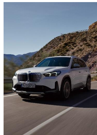
BMW 社製の電気自動車を導入予定 (写真はイメージです)