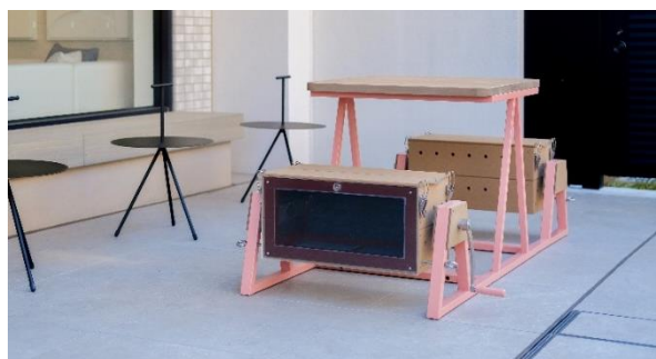
コンポストチェア

居住者さまが自分たちの手で作業することで、楽しみながら「循環」を学べる取り組みになります。