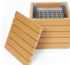
※かまどスツール 参考イラスト

※1 豊橋市でZEH-M Orientedの認定を受ける初の分譲マンションとなります。