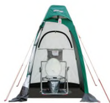
※非常用マンホールトイレ 参考写真

万一の災害発生時に備え、マンホールの蓋を外して設置するトイレ、炊き出しに利用できるかまどスツールを設置しています。