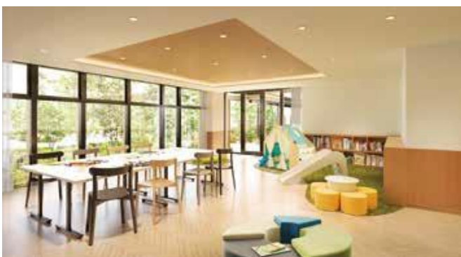
キッズスクエアディスカバー完成予想図

共用施設の「キッズスクエアディスカバー」にて、株式会社キボットの専門スタッフによる「お子さまみまもりサービス」を導入。どうしても外せない予定や仕事の都合で不在の際などに安心して利用できます。多様性のある働き方を促すことで、共働き世帯の活躍を後押しすることを通じ、サステイナブルな社会・経済の実現に貢献します。