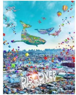
本物件のコンセプトビジュアル

「DISCOVER WONDER CITY」というプロジェクトコンセプトのもと、ワクワクと心躍る「ワンダーなモノ・コト」にあふれるくらしとなるような空間設計としております。噴水を設置しファミリーが憩える「みんなの広場」や、グランピング・バーベキューといったアウトドアレジャーを楽しめる「ルーフトップガーデンワンドル」、仲間とのパーティーを楽しめる「パーティサロンワンダー」など、6つのガーデン&8つのコモンスペースを創出し、571世帯の多様なくらしを支えています。