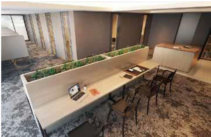
ワーク&スタディラボ完成予想図

本を通じて人々の生活を豊かにし、社会をよくすることを目指す株式会社バリューブックスと提携し、新刊と古本、そして居住者様より持ち寄られた本を集めて循環させるサービスを導入。「ワーク&スタディラボ」内には約1,000冊（予定）、「キッズスクエアディスカバー」内には約500冊（予定）を蔵書し、居住者様専用のライブラリとして閲覧・貸出、また不要になった本を寄贈することもできます。