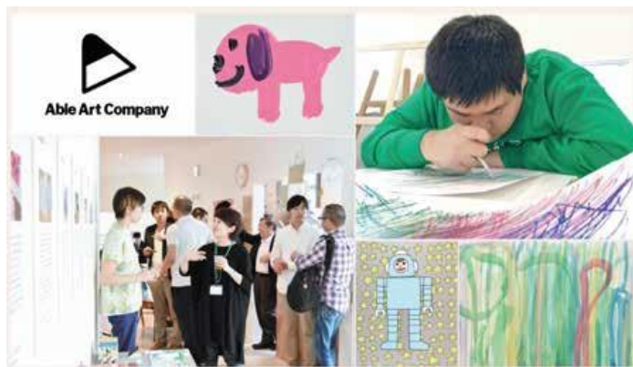
パラアートイメージ写真