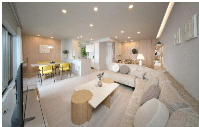
リビングダイニング②