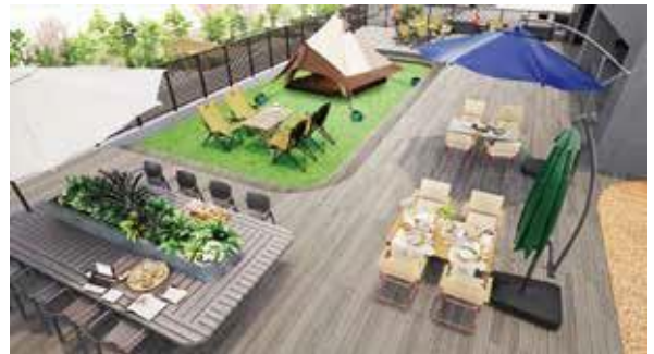
「ルーフトップガーデンワンドル」完成予想図