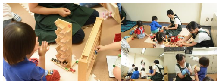
託児風景イメージ写真