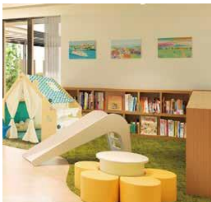
キッズスクエアディスカバー完成予想図

「キッズスクエアディスカバー」に、エイブルアート・カンパニーの協力のもとパラアーティスト（障害をもったアーティスト）が自由な発想で制作した、ここでしか鑑賞できない作品を展示。気軽にアートに触れられる環境が、子どもたちの様々な可能性を広げます。