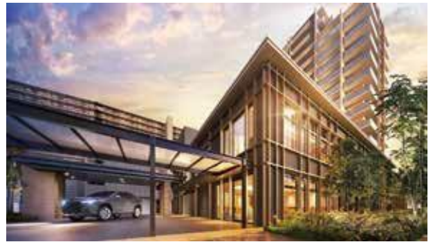
「コーチエントランス」完成予想図