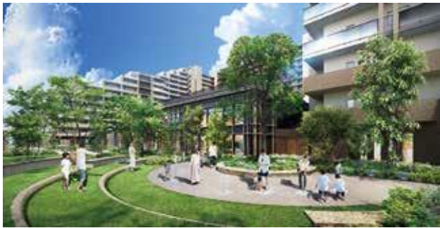
「みんなの広場」完成予想図