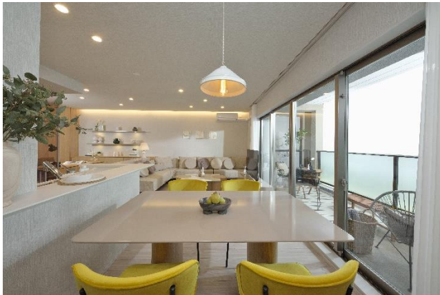
リビングダイニング①

モデルルームは、レディースファッションブランド「SNIDEL(スナイデル)」やルームウェアブランド「gelato pique(ジェラートピケ)」などを運営するマッシュグループによるコーディネート提案を採用。ファッション業界において、積極的にSDGsに取り組んでいる同社の発案のもと、家具の一部に「リユース家具」を採用します。リユースマーケットにて購入した家具にパーツの変更や生地の変更等のリノベーションを行い、新たな価値を付加したものをモデルルームに設置することで、資源の有効活用に貢献いたします。