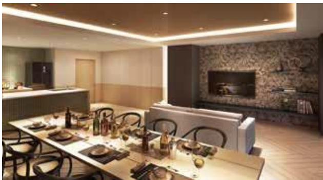
「パーティサロンワンダー」完成予想図