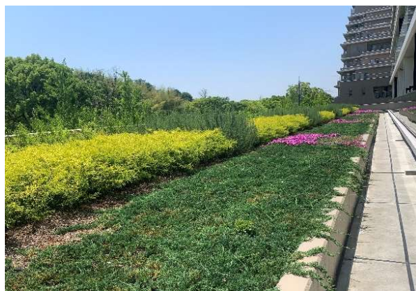
3階バルコニーの多様な低木植栽