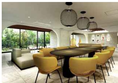
【コミュニティラウンジ】