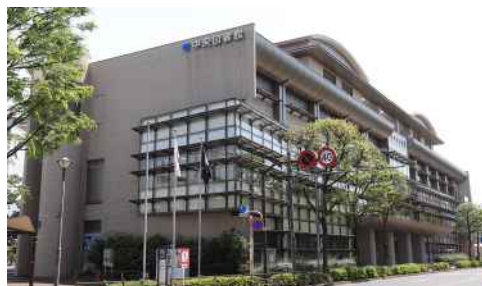
【江戸川区立中央図書館】