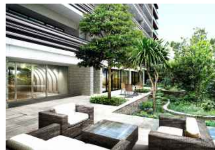
【サンパティオ（中庭）】