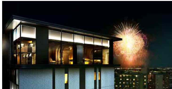
【「プレミスト新小岩ルネ」イメージ】

今回販売する「プレミスト新小岩ルネ」は、東京都江戸川区で豊かに暮らすことを目指した「TOKYO EDENCE ※1 PROJECT」をコンセプトとし、徒歩5分圏内に商業施設や医療施設、教育・子育て支援施設、公園などの生活利便施設が充実した子育てにも適した分譲マンションです。