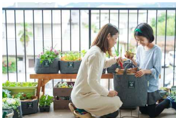
【家庭菜園イメージ】