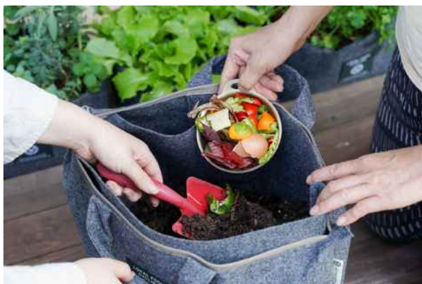
【コンポストセット専用バッグ】

生ごみを捨てる手間や生ごみ臭を解消するとともに、できた堆肥はバルコニーでプランター等による家庭菜園にも活用できます。コンポストをバルコニーに置いて、2カ月生ごみを投入し、3週間熟成させると堆肥が完成。臭いもほぼなく、生ごみを入れて混ぜるだけなので、子どもからお年寄りまでお手軽にできるエコな取り組みです。