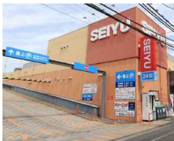
【西友江戸川中央店】