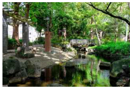
【小松川境川親水公園】