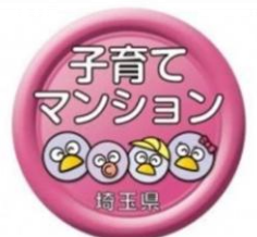
埼玉県子育て応援マンション 認定マーク