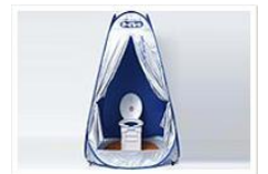
マンホールトイレ