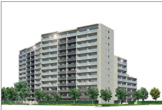
「ルネ蕨ガーデンシティ」完成予想図

本協定は、市政運営の基本指針である「コンパクトシティ蕨」将来ビジョンに掲げるまちの将来像「安心とにぎわい みんなにあたたかい 日本一のコンパクトシティ蕨」の実現に向け、「みんなで未来の蕨を創る」をまちづくりの理念として推進する蕨市と、「街と暮らしと未来のために」を企業スローガンに掲げ、地域・市民に貢献するマンションづくりを目指す総合地所の理念が融合。行政が推進する市政運営の基本指針の趣旨を、民間の分譲マンション開発事業者が反映し、事業を展開するという今後の官民連携事業のモデルを目指した取り組みでございます。